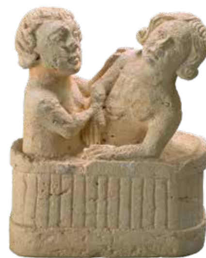
6. Πώρινο σύμπλεγμα σήμανσης δημόσιου λουτρού (mascaron). Προβηγκία. Τέλος 13ου-αρχή 14ου αιώνα. Musée d'histoire de Marseille. 6. Limestone bath sign statuette (mascaron). Provence. Late 13th-early 14th century. Musée d'histoire de Marseille.